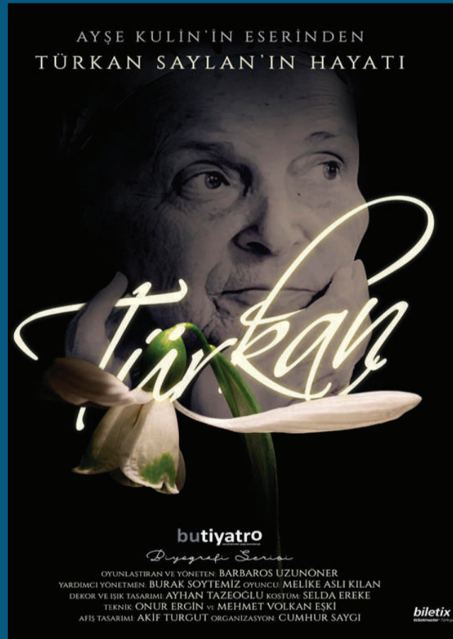
AYŞE KULİN'İN ESERİNDEN TÜRKAN SAYLAN'IN HAYATI

le Canım" parçasının müziği Melih Kibar, sözleri Çiğdem Talu, yeni düzenlemesi Alper Erinç, yapımcılığını Seda Sertbaş üstlendi. Avrupa Müzik markası ile her ay bir eserin yayınlanacağı Melih Kibar ve Çiğdem Talu şarkılardan oluşan albümde müzikseverleri Türk müziğine yön vermiş sürpriz isimler bekliyor. Eminim çok güzel bir albüm oldu. Tam arşivlik bir iş, dinleyeceğim.