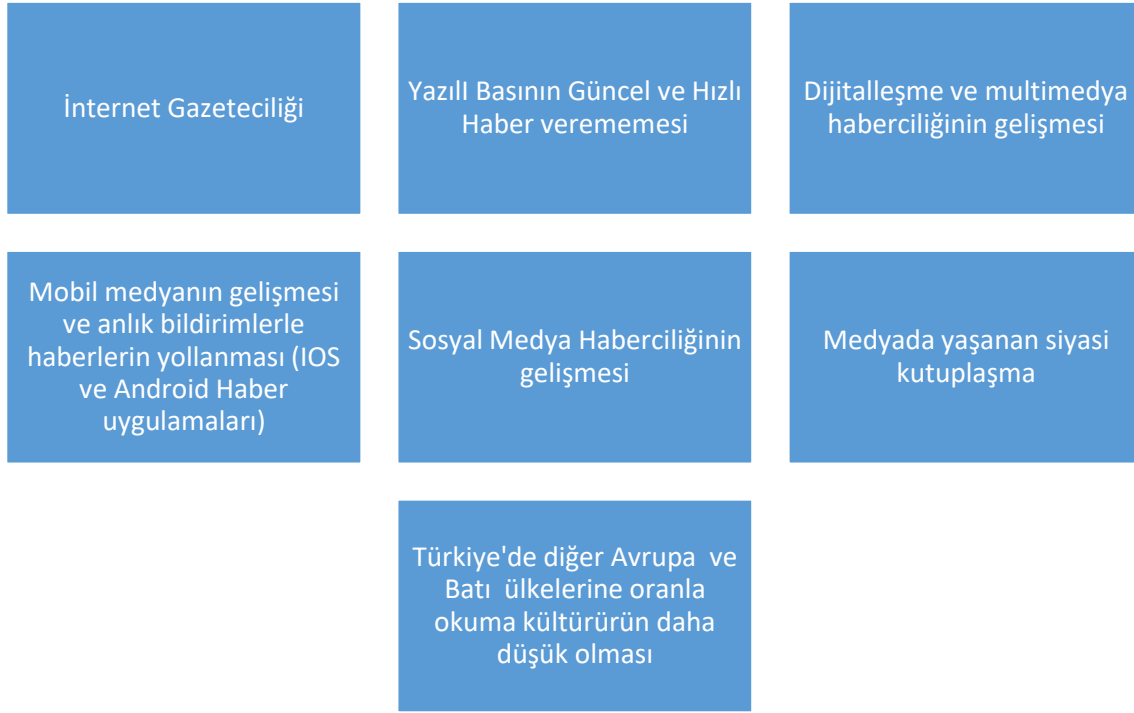
Şekil 3. Araştırmada elde edilen bulguların kategorileştirilmiş tablosu